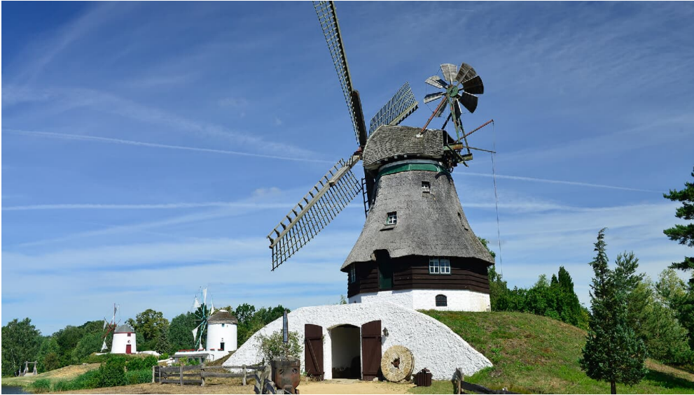
Kellerholländer Mühle im Mühlenmuseum Gifhorn

15.03. - 31.10. Dienstag bis Sonntag 10:00 - 18:00 Uhr letzter Einlass 17:00 Uhr Gastronomie am Dorfplatz bis 21:00 Uhr Ruhetag: Montag (Brückentage ausgenommen) Ab dem 05.01.2024 Trachtenhaus: Freitag bis Sonntag 10:00 - 19:00 Uhr Hofladen: Freitag bis Sonntag 10:00 - 18:00 Uhr Museum & Kirche: Geschlossen