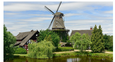
Blick auf die Sanssouci-Mühle im Mühlenmuseum Gifhorn