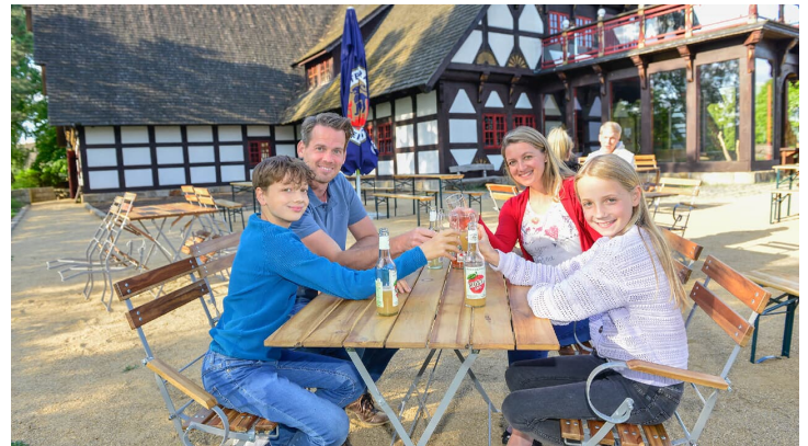
Familie im Mühlenmuseum Gifhorn - © Südheide Gifhorn GmbH/Frank Bierstedt