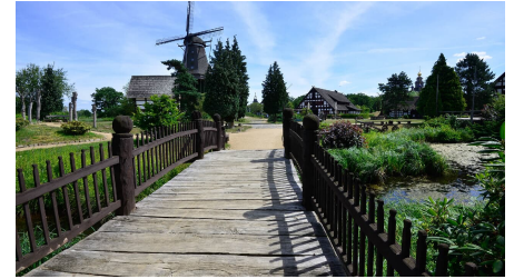
Blick auf den Niedersachsenplatz im Mühlenmuseum Gifhorn