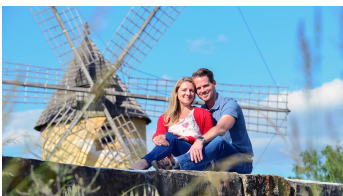
CC0 FPaar vor der Mallorcamühle im Internationalen MühlenmuseumB_8009239.JPG - © Südheide Gifhorn GmbH/Frank Bierstedt