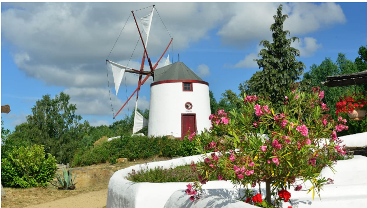
Portugiesisch Mühle im Mühlenmuseum Gifhorn