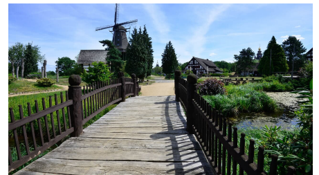
Blick auf den Niedersachsenplatz im Mühlenmuseum Gifhorn