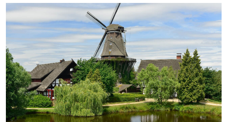
Blick auf die Sanssouci-Mühle im Mühlenmuseum Gifhorn