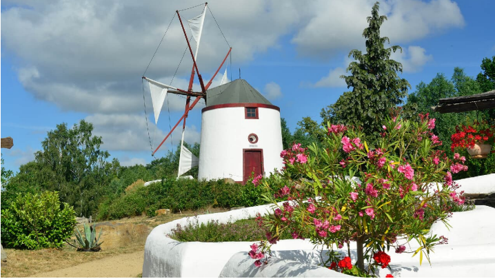
Portugiesisch Mühle im Mühlenmuseum Gifhorn