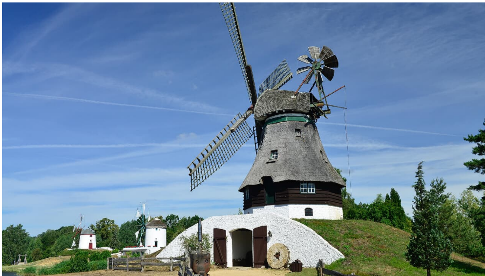
Kellerholländer Mühle im Mühlenmuseum Gifhorn - © Südheide Gifhorn GmbH/Frank Bierstedt