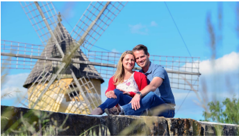
CC0 FPaar vor der Mallorcamühle im Internationalen MühlenmuseumB_8009239.JPG - © Südheide Gifhorn GmbH/Frank Bierstedt