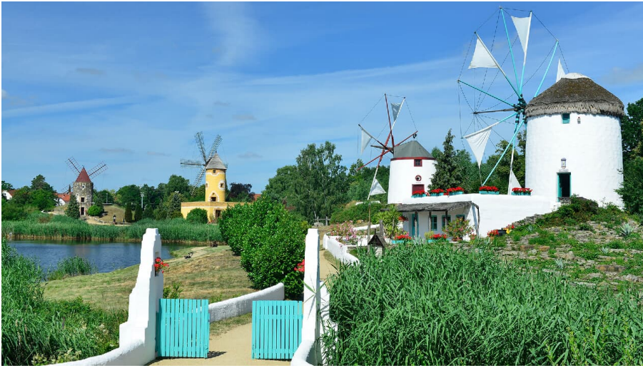
Südländische Mühlen im Mühlenmuseum Gifhorn