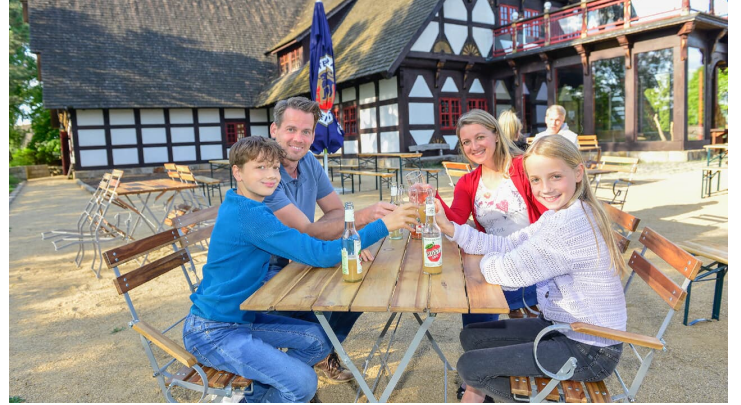
Familie im Mühlenmuseum Gifhorn